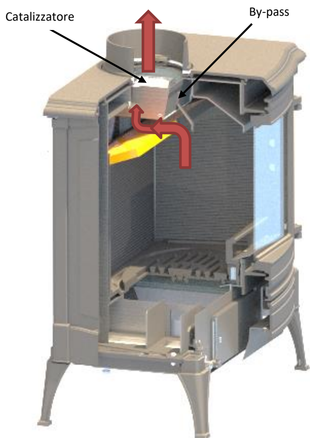
Fig. 8 By-pass chiuso

Ciò viene ottenuto dal sistema catalitico installato nella parte superiore della camera di combustione. La chiusura del bypass, una volta che la camera di combustione ha aumentato la sua temperatura, consentirà ai gas di ricircolare attraverso il catalizzatore, dove si verificherà una reazione chimica, in cui scomparirà la stragrande maggioranza delle emissioni generate durante il processo di combustione.