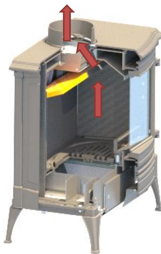
Fig. 9. By-pass aperto